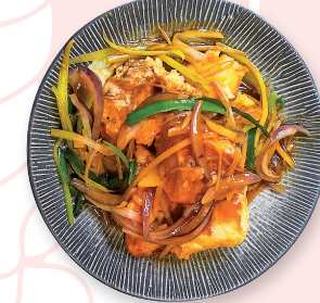
Cabillaud frit sauce gingembre et poireau

STF Tofu sauté au porc haché épicé, épinards, œuf 16.00€ ほうれん草入り麻婆豆腐 Tofu with spinach eggs and spicy minced pork