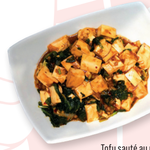
Tofu sauté au porc haché épicé, épinards, œuf.

S20 KATSU CURRY Porc panée sauce curry 18.00€ かつカレー KATSU CURRY Breaded pork with curry sauce