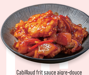
Cabillaud frit sauce aigre-douce

S15 Cabillaud frit sauce gingembre et poireau 18.00€ 魚のしょうがねぎ醤油ソース Deep fried cod fish with ginger sauce