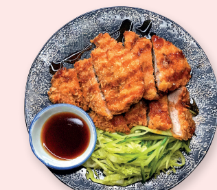
Filet mignon de porc panée

S17 Poulet frit parfumé au gingembre et coriandre 17.00€ 四川風鶏の唐揚げ辛味ソース Fried chicken with ginger and coriander