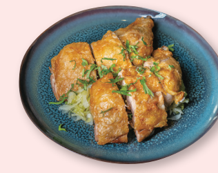
Poulet frit parfumé au gingembre et coriandre

S19 Riz au curry à la japonaise avec bœuf 18.00€ カレーライス (牛肉) Japanese curry rice with beef