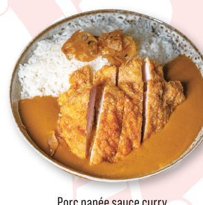
Porc panée sauce curry

ST TONKATSU Filet mignon de porc panée 17.50€ とんかつ TONKATSU Breaded Pork Tenderloin