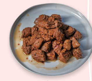
Bavette de bœuf sauté au poivre noir

S13 Bavette de bœuf sauté au poivre noir 18.00€ 牛肉の黒胡椒ソース炒め Stir fried black pepper beef