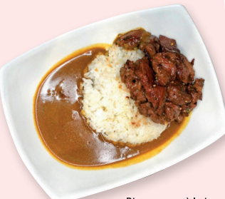
Riz au curry à la japonaise avec bœuf

S13 Bavette de bœuf sauté au poivre noir 18.00€ 牛肉の黒胡椒ソース炒め Stir fried black pepper beef